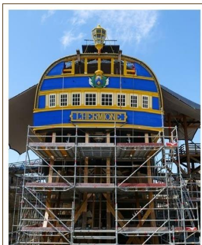
Grand carénage de la frégate Large refit of the frigate L'HERMIONE Port de BAYONNE Pyrénées-Atlantiques, FRANCE